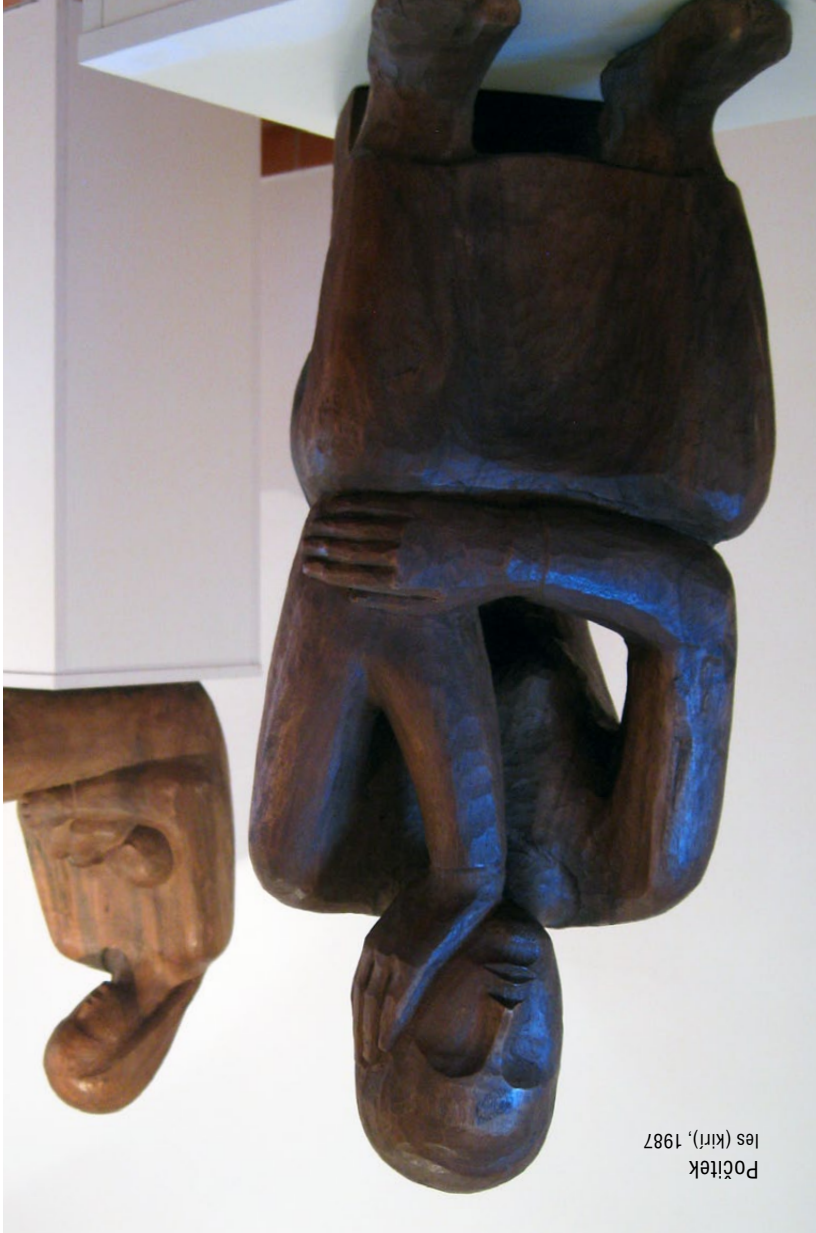
Počitek les (kiri), 1987