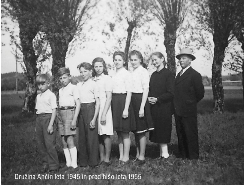
Družina Ahčin leta 1945 in pred hišo leta 1955