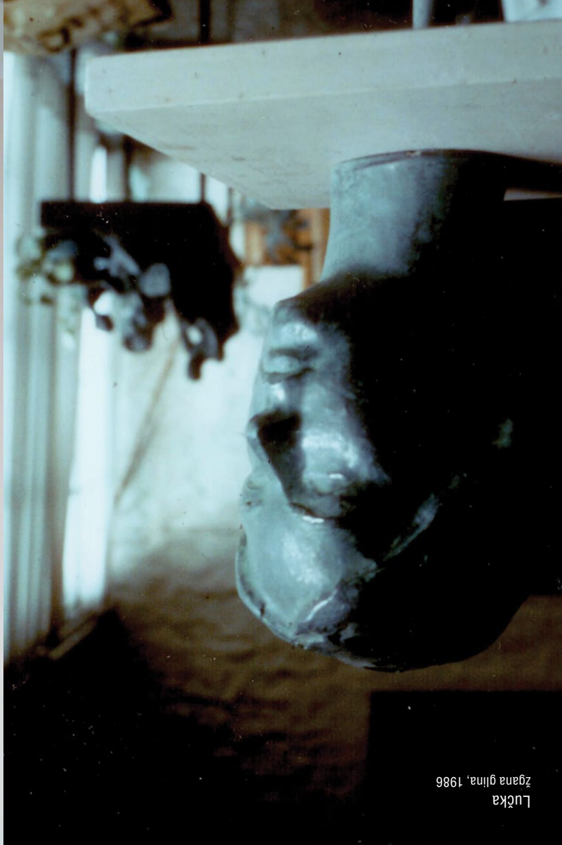
Lučka žgana glina, 1986