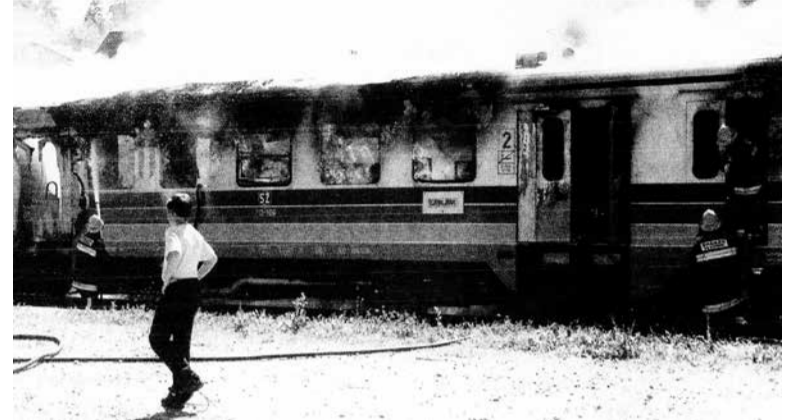
V Kamniku so vandali 9. junija 1999 zažgali vlak, ki je popolnoma pogorel. Povzročiteljev niso nikoli našli.

Med vsemi nesrečami na kamniški progi so najbolj odmevale smrtno nesreče na nivojskem križanju ceste in proge v Depali vasi. Na tem nezavarovanem prehodu se jih je zgodilo več. Kljub prošnjam, potem pa ob vse bolj glasnih zahtevah prebivalcev Depale vasi, se oblasti (tako občinske kot železniške) dolgo časa niso zganile. Ljudje so se morali organizirati civilno. Na iniciativo ob-