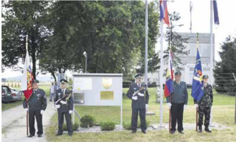
Počastitev spomina na rojstvo naše države

Ob trideseti obletnici naše države smo se na radio oddajniku Domžale zbrali tisti, ki smo ga leta 1991 branili.