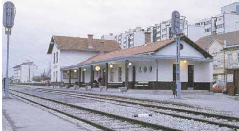
V 130-letni zgodovini je železniška postaja v Domžalah doživela marsikaj, od sprejemov državnikov do tega, da so jo požgali vandalski uničevalci.

Nevsakdanja nesreče se je pripetila 15. junija 1950 v Črnučah, ko je za-