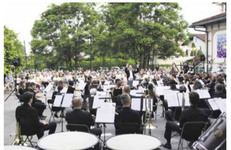
Dvorišče Kulturnega doma Franca Bernika se je izkazalo za nadvse primerno koncertno prizorišče.