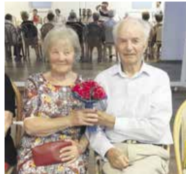
Najstarejši zakonski par društva MDJC

Večdnevno letovanje starejših v okviru vodnega programa je eden izmed priljubljenih programov v MD Jesenski cvet. Tabor je namenjen druženju starejših, njihovem povezovanju in širjenju socialne mreže. Je pri-