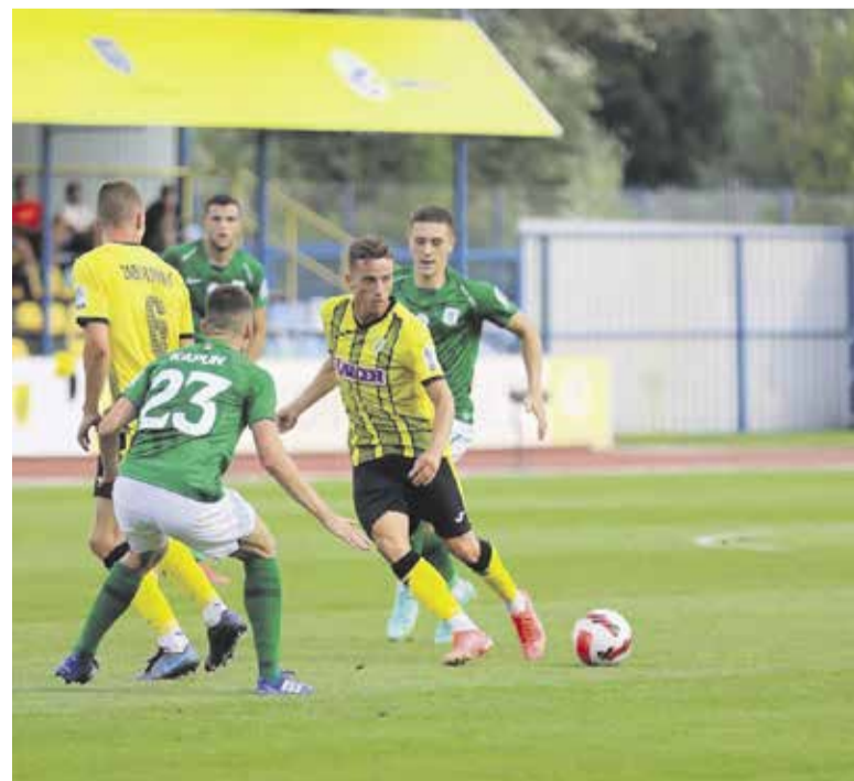
Mlinarji se na uvodu sezone še zdaleč niso ustrašili tekmecev.