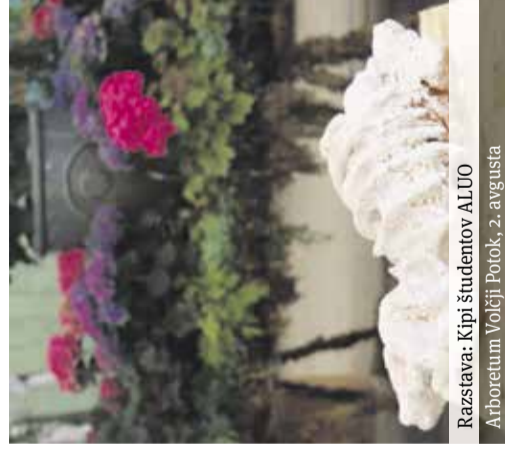
Film: Kruela Arboretum Volčji Potok, 7. avgusta