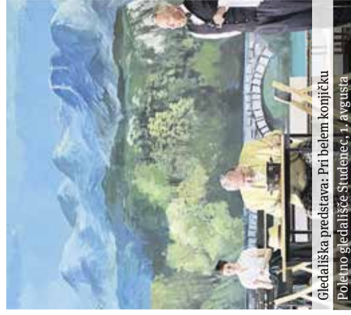
Gledališka predstava: Pri belem konjičku Poletno gledališče Studenec, 1. avgusta