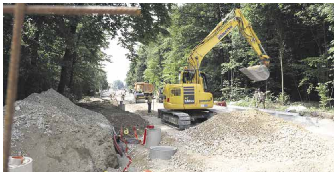
Dela na Igriški cesti v Jaršah

sko-vzdrževalnimi deli na vodovodu na Goričici pri Ihanu. Na Gasilski poti v Jaršah, Kokaljevi in Rudniški ulici so zaključena obnovitvena dela na vodovodu in kanalizaciji ter na hišnih vodovodnih priključkih. Potekajo zaključna dela na vzpostavitvi pešcev in voznih površin. Na Igriški ulici v Jaršah je vzpostavljena popolna zapora ceste zaradi rekonstrukcije ceste in izgradnje obojestranskega pločnika. Dela bodo predvidoma zaključena do 1. septembra 2021. Na Opekarniški cesti v Radomljah je obnovljeno meteorno in fekalno kanalizacijsko omrežje, predstavljena javna razsvetljava, položeni so elektro vodi. Trenutno se izvaja hodnik za pešce, sledi asfaltiranje vozišča. Dela bodo predvidoma zaključena do konca avgusta 2021. Na cesti skozi Škrjančevo, Vir-Radomlje je obnovljeno vodovodno in kanalizacijsko omrežje, predstavljena javna razsvetljava. Trenutno sta v delu avtobusna postaja in hodnik za pešce, sledi asfaltiranje vozišča. Poteka tudi obnova dilatacij na nadvozu nad AC-izvoz Domžale. Sanirana je bila hidroizolacija na območju vgradnje dilatacij. V teku je vgradnja dilatacij na obeh straneh nadvoza. Sledi končno asfaltiranje, predvidoma v sredini avgusta 2021.