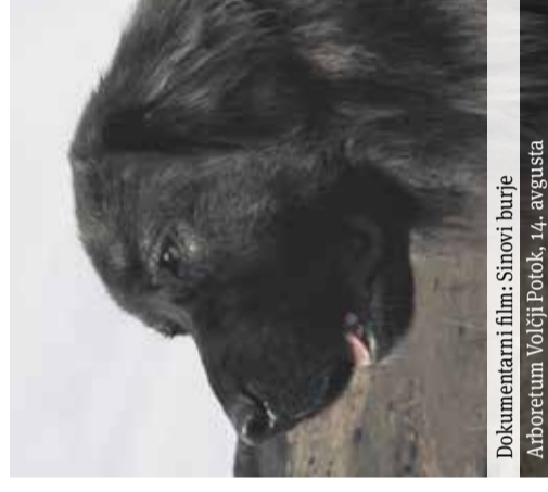
Dokumentarni film: Sinovi burje Arboretum Volčji Potok, 14. avgusta