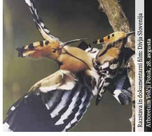
Razstava in dokumentarni film: Divja Slovenija Arboretum Volčji Potok, 28. avgusta