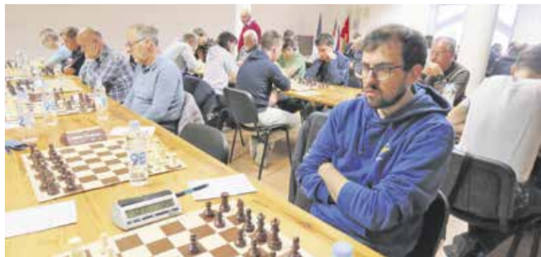
ŠD Domžale med dvobojem z SIJ Acroni Jesenice

Tudi tokrat bi vas povabil k igranju namiznega tenisa, saj je to izredno zanimiv in dinamičen šport, in če vas je zagrabila želja, da bi začeli igrati namizni tenis (rekreativno ali tekmovalno), se nam pridružite. Namiznoteniška sekcija Mengeš (NTS Mengeš) še vedno vabi k vpisu igranja namiznega tenisa – tako na tekmovalni kot rekreativni ravni. Treningi potekajo v popoldanskem času v naši dvorani v Mengšu, zato zberite pogum in se od ponedeljka do petka (med 16. in 20. uro) oglasite v naši dvorani, kjer boste iz prve roke boste dobili vse potrebne informacije (o času in pogostosti treningov, opre, ceni itd.). Treningi za rekreativce pa, kot že vrsto let, potekajo v ponedeljek in petek od 20. do 22. ure ter v nedeljo od 9. do 11. ure. Za namizni tenis ni nikoli (pre)pozno. JANEZ