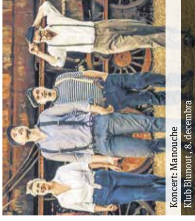
Koncert: Manouche Klub Blunout, 8. decembra