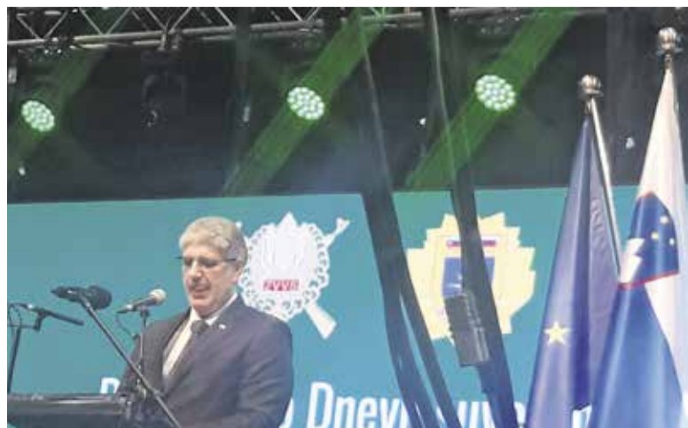
Slovesnost na Ptuj ob dnevu suverenosti – minister Boštjan Poklukar