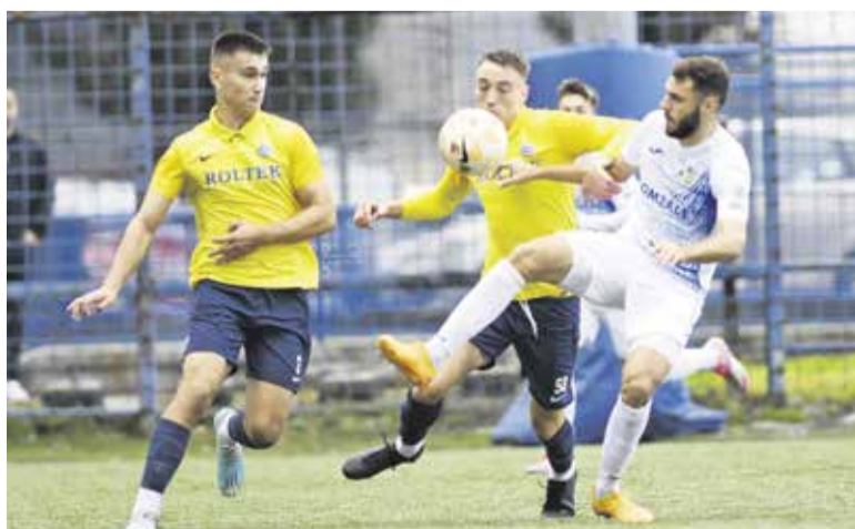
Dobljeni so drago svojo kožo prodali tudi na tekmi 2. kroga Pokala Slovenije proti sosedom iz Domžal, ki so slavili (zgolj) z 1:0.

Dob se je sicer najprej veselil domače zmage proti Brdom s 4:0, sledila pa je zgoraj omenjena tekma proti