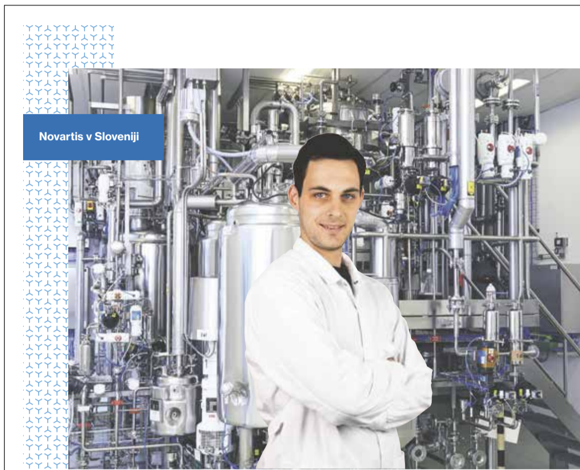
Novartis v Sloveniji

to ljubezen do ustvarjanja in umetnosti, ki oba spremlja že iz mladosti, sta želela ujeti tudi v samem prostoru galerije. Tako kot v svojih delih sta tudi pri izbiri interierja tradicionalne elemente združila z modernimi, ustvarjala kontraste in v smiselno celoto vključila razstavljena dela. Njun cilj je, da se v tem prostoru izražata ter se pokažeta širši javnosti. V galeriji ne promovirata samo svojih izdelkov, ampak tudi sebe kot umetnika. Ljudem želita približati vsak svoj poseben stil in unikatne umetnine. Poleg tega pa želita z galerijo dati