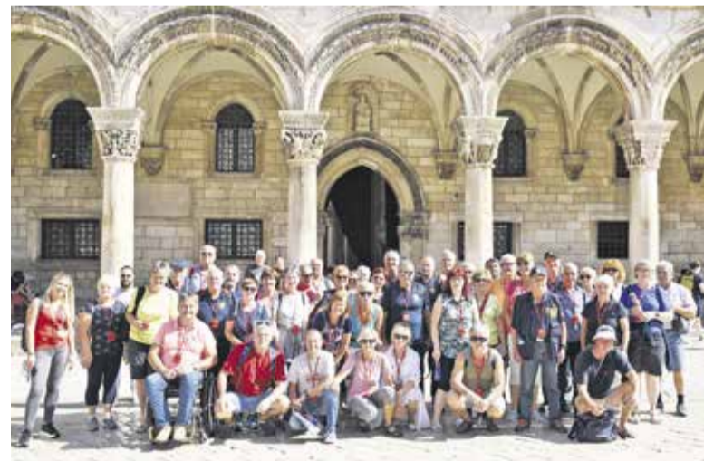
Spomin iz Dubrovnika

Ekskurzija je bila tridnevna, tako smo najprej obiskali dalmatinsko metropolo Split, naslednji dan pa še Dubrovnik, kjer smo si ogledali starodavno mesto, najbolj pa nam je ostala v zavesti izjemna diplomatska sposobnost nekdanje Dubrovniške republike, ki je obstajala vse od 14. do začetka 19. stoletja. V tem obdobju so nekako tekmovali z Beneško republiko, kar jim je dobro uspelo, saj so imeli v tistem času kar 50 konzulatov in ambasad. Z izjemno diplomatsko prefinjenostjo so doživeli največji razcvet. Glavna dejavnost pa je bila trgovina z rudami, srebrom, bakrom, svincem ter soljo in začimbami. Najbolje so trgovali s Turki in tako vzdrževali večstoletno obdobje brez vojn. V letu 1699 so jim celo odstopili del ozemlja, kjer se nahaja današnji Neum (BiH). Seveda so prišli tudi težki časi predvsem s prihodom Avstro-Ogrske in kasneje z Ilirskimi provincami. Izjemno hudo pa je Dub-