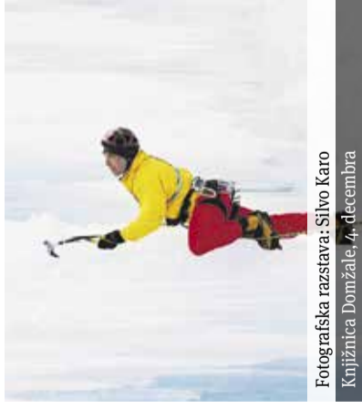
Fotografska razstava: Silvo Karo Knjižnica Domžale, 4. decembra