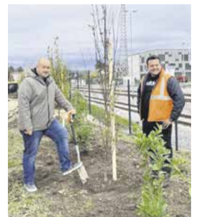
Zasaditev ob železnici, Občina Domžale

Nova, medovita drevesa pa bodo v novembru zasajena tudi v vseh domžalskih krajevnih skupnostih. Pobuda Občine Domžale za njihovo zasaditev poteka v sodelovanju s