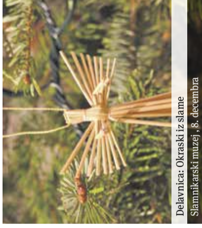
Delavnica: Okraski iz slame Slamnikarski muzej, 8. decembra