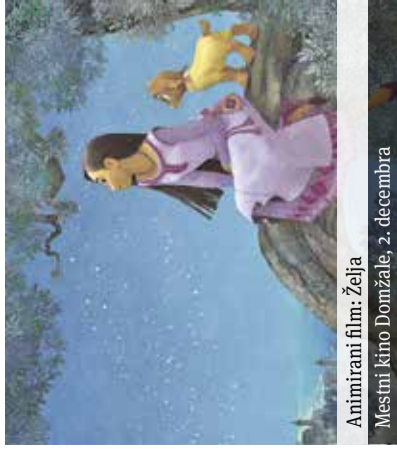
Animirani film: Želja Mestni kino Domžale, 2. decembra