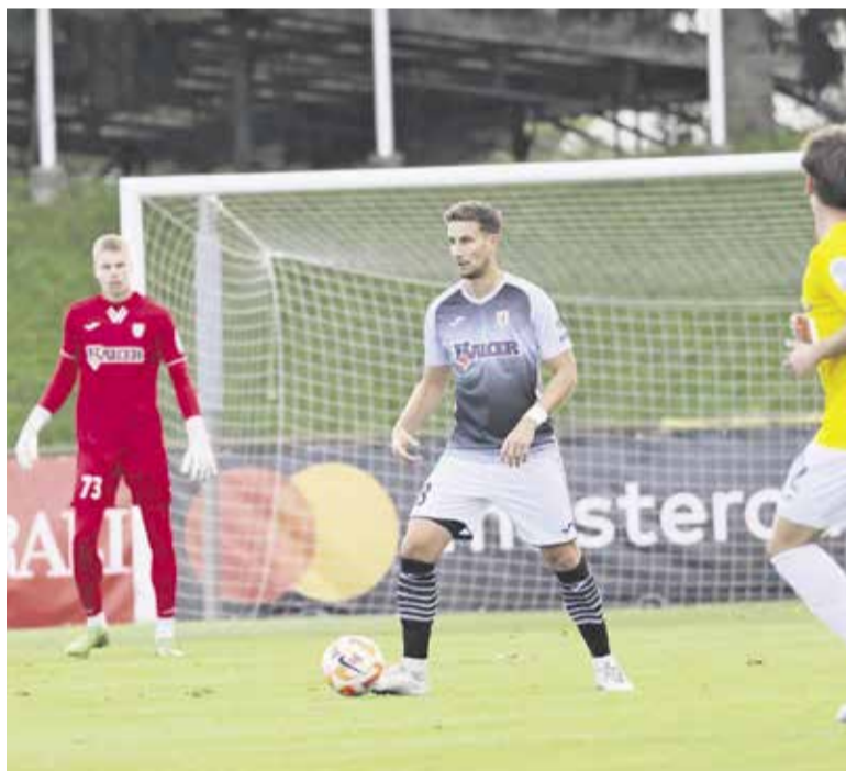
Mlinarje je na zadnjih dveh tekmah še kako tepla neučinkovitost v napadu in nepazljivost v obrambi.