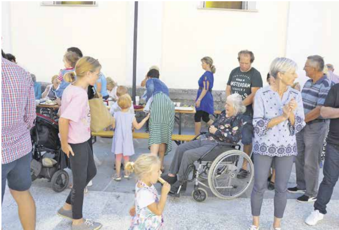
Srečanje bolnih in ostarelih je vedno prijeten dogodek tako za njih same kot za bližnje in širšo skupnost.