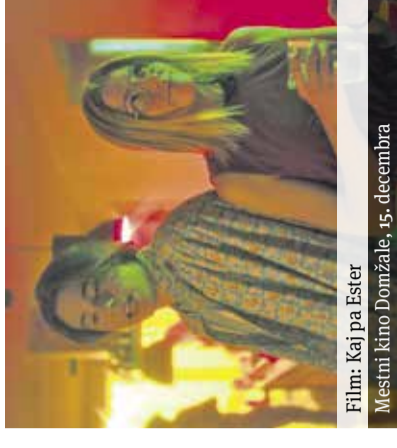
Film: Kaj pa Ester Mestni kino Domžale, 15. decembra