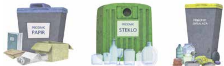
Odpadno embalažo pravilno ločujemo in omogočimo recikliranje.

3. Če se embalaži ne moremo izogniti, izberimo izdelke v biorazgradljivi embalaži, povratni embalaži in embalaži, ki jo lahko ponovno uporabimo.