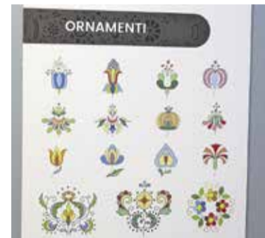
Jedro Karlovških raziskav so bili ornamenti. Ni jih le zbiral, pač pa ustvarjal tudi svoje.