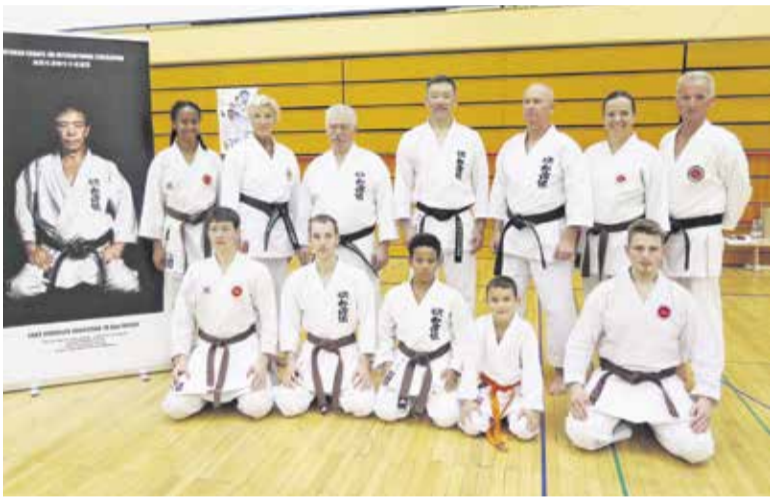
Ruše – Kancho Nobuaki Kanazawa 8.Dan in karate klub Atom Domžale

Takoj naslednji vikend od 19. do 22. oktobra 2023 smo člani karate kluba Atom Domžale odšli na mednarodni seminar z japonskim in-