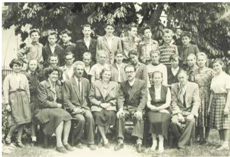
Skupina učiteljev in učencev meščanske šole leta 1940

ška občina. Vpis 126 učencev in učenek kaže, kako velike so bile potrebe po nadgradnji osnovnega šolstva, z njim pa so kar štirikrat presegle zakonski minimum za njeno ustanovitev. Le prvo leto je šolo obiskovalo tudi nekaj učencev s kamniškega območja, leta 1939 pa je bila ustanovljena meščanska šola tudi v Kamniku. V šolskem letu 1940/41 je nad 200 učencev in učenek obiskovalo tri razrede s šestimi vzporednicami, število predmetnih učiteljev pa se je do tedaj povečalo na 11. Šolski upravni odbor iz predstavnikov 12 občin je skrbel za materialne izdatke šole. Leta 1940 je sklenil, da bo šolsko stavbo dozidal, skupaj z učiteljskim zborom in starši pa je tudi odločil, da bodo glede na značaj gospodarstva na ožjem domžalskem območju v tretjem razredu začeli izvajati program za industrijsko-obrtno smer. Na željo okoliških občin pa je meščanska šola za potrebe kmečkega okoliša nudila učencem na šolskem vrtu tudi nekaj praktičnega znanja iz agrarnih panog.