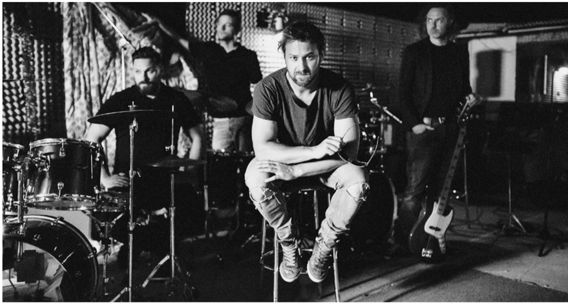
Drugi dan festivala bo nastopil tudi domžalski bend Lusterdam, ki je s skladbo Lepo mi godrnjaš pred kratkim zmagal za popevko tedna na Valu 202.

Pred 22 leti si sploh nisem predstavljal, da bom toliko let uspel organizirati ta glasbeno-kulturni dogodek, ki ga tako rado obiščejo vse generacije iz okolice, zadnja leta pa tudi iz oddaljenejših krajev iz Slovenije.