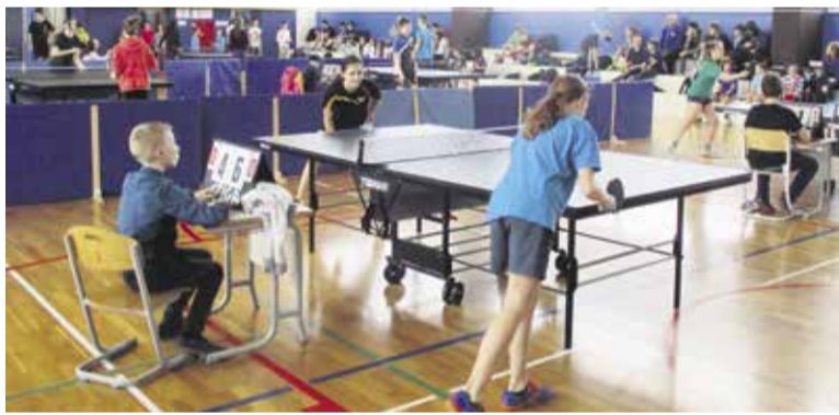
Na območnem tekmovanju so med seboj prekržili namiznoteniške loparje najboljši iz osnovnih šol domžalske, kamniške in medvoške regije.