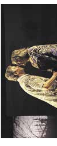
Predstava - Staromodna komedija KD Franca Bernika, 22. maj

20.30 | PREPLESAVANJE Preplesavanje družabnih plesov za vse stopnje / namenjeno tudi zunanjim obiskovalcem / vrтели se boste na mehansko glasbo / več informacij na www.mikiples.com