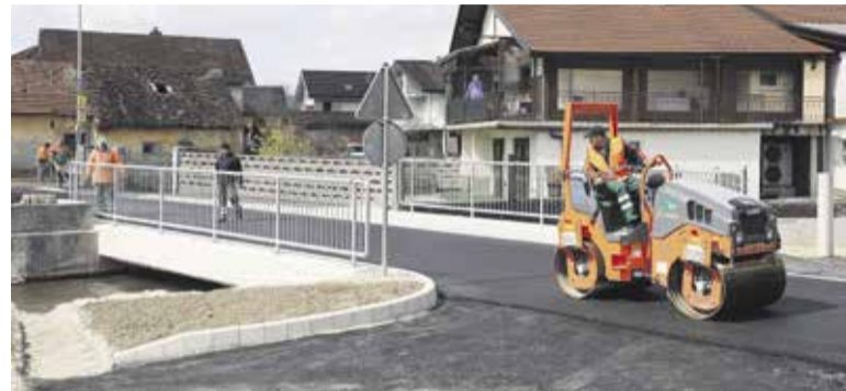
Nov most čez Mlinščico na Podrečju (foto: Vido Repanšek)

ceste AC-grad Krumperk. Zaključek del je predviden 21. maja. V naselju Krtina, skupaj z Direkcijo RS za infrastrukturo, izvajamo rekonstrukcijo križišča. Promet je urejen s polovično zaporo in poteka pod začasnimi semaforji. Zaključujemo rekonstrukcijo ceste skozi Turnše. Lokalna cesta skozi to naselje je izvedena za dvosmerni promet, vozišče se je večinoma razširilo na vozni pas širine 5 m, hodnik za pešce in utrjeno bankino. V strnjem delu naselja je hitrost omejena na 40 km/h. Hodnik za pešce je izveden na celotni trasi rekonstruirane ceste. Za umirjanje prometa so skozi naselje