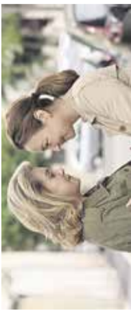
Drama - Babica Mestni kino Domžale, 4. maj