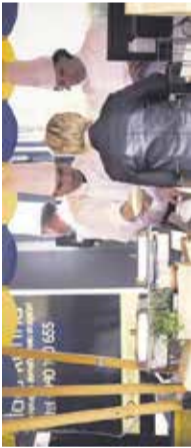
Dogodek - Kuhna na plac Prireditvena ploščad ob tržnem prostoru, 5. maj

Mestni kino Domžale 20.00 | V CIAMBRI Drama / film, posnet s člani romske družine, pripoveduje avtenično zgodbo o fantu, za katerega