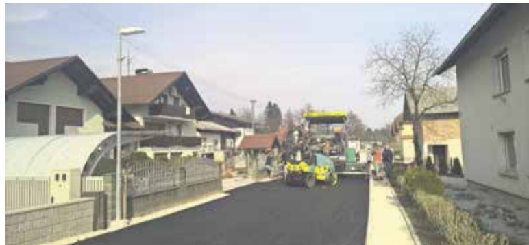
Asfaltiranje ceste skozi naselje Turnše

Tretja etapa prenove Bukovčeve ulice na Viru, zaključek rekonstrukcije ceste skozi Turnše in nov most čez Mlinščico na Podrečju