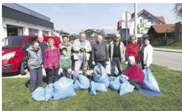
Čistilna akcija v Krajevni skupnosti Dob

Javno komunalno podjetje Prodnik je v sodelovanju z Občino Domžale priskrbelo vrečke za smeti, rokavice in za-bojnike. Prav tako so po akciji poskrbe-