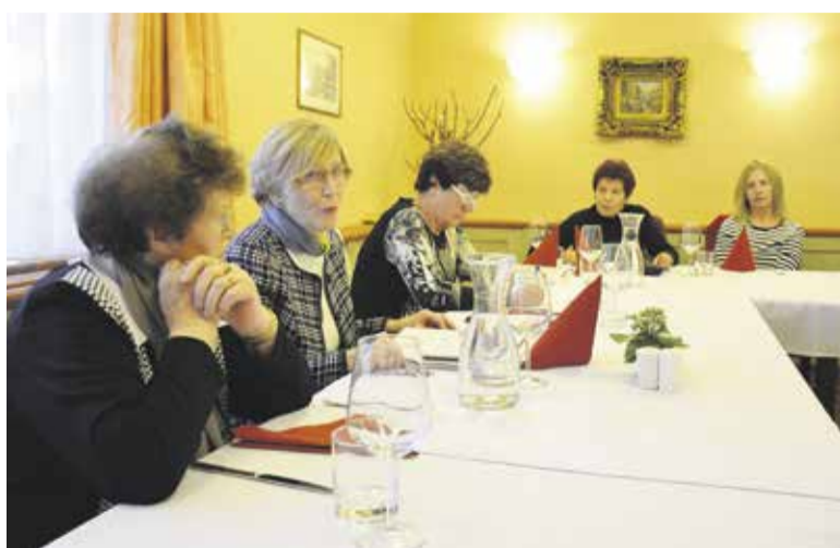
Z občnega zbora KO ZB Simona Jenka