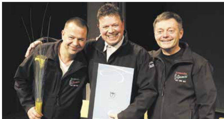
Narodno-zabavni ansambel Gamsi, nagrada Občine Domžale