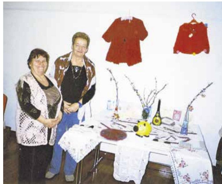
Utrinek z razstave skupine Nagelj ob zboru članstva v maju v Delavskem domu Trbovlje

in druženje, pa tudi skrb za zdravje in rekreacijo. V društvenih prostorih so zelo aktivne članice skupine Nagelj, ki se ukvarjajo z ročnimi deli. So zelo pridne in svoja ročna dela razstavljajo, še posebej ob različnih srečanjih vojnih invalidov. Vse leto so zelo prizadevne in natančne tako pri pletenju kot vezenju, izdelavi vo-