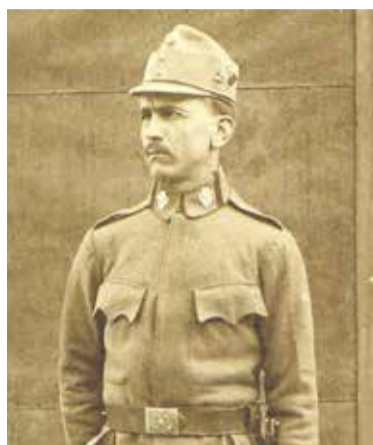
Neznani vojak iz Kofutnikovega