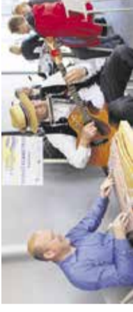
Prireditiev - S citrami po Domžalah V centru Domžal, 19. maj

Mestni kino Domžale 18.00 | BABICA Drama / zgodba o nenavadnem prijateljstvu med dvema zelo različnima ženskama, v kateri blestita veliki imeni francoskega filma: Catherine Frot in Catherine Deneuve.