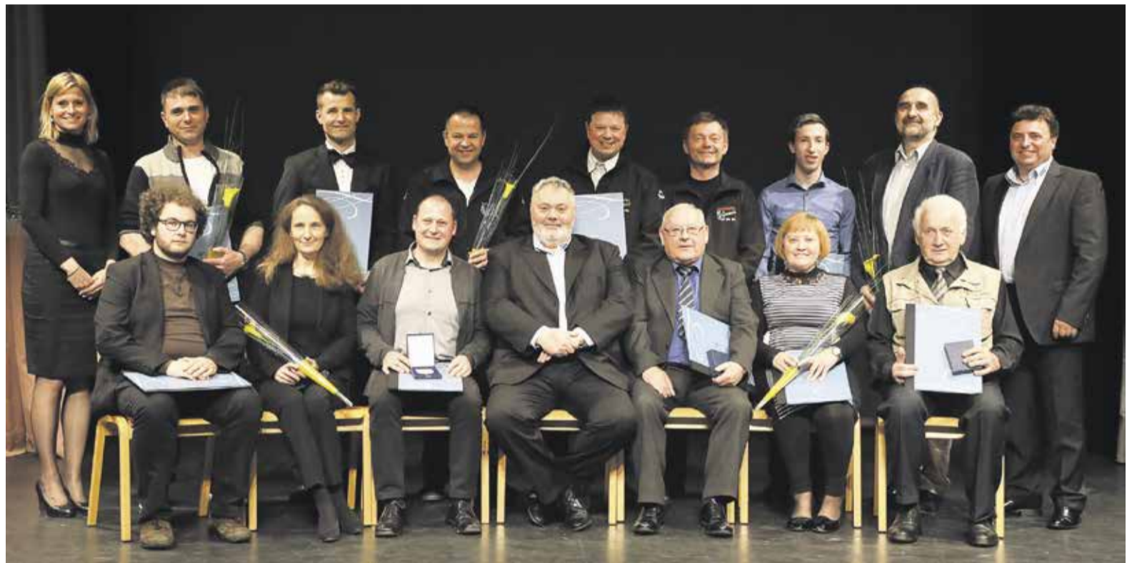
Nagrajenci Občine Domžale za leto 2017

Že pri sedmih letih je na Pšati igral v domačem kulturnem društvu