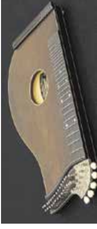
Vodeni ogled po razstavi Citer Galerija Domžale, 19. maj

Knjižnica Domžale 17.00 | ZAIGRAJ KAMIŠIBAJ Domišljene zgodbe s sliko in besedo / vstop prost /