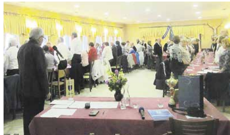
Z minuto molka se je Društvo upokojencev Domžale spomnilo umrlih članov in članic.

podpredsednica Zveze društev upokojencev Slovenije. Izpostavila je zlasti: pomoč starejšim zaradi neodzivna države oziroma nesprejema Zakona o dolgotrajni oskrbi, poteku projekta Starejši za starejše tudi v DU Domžale, vzpostavitev sistema, ki bo zagotovil pomoč, skrb in nego vsem starejšim – ob pomoči družinskih članov, ne pa v njihovo breme; pomen spodbujanja državnih organov, da se zakonodaja čim prej sprejme, in povabila vse člane društva, da se aktivno, tudi kot prostovoljci, vključijo v delo društev.