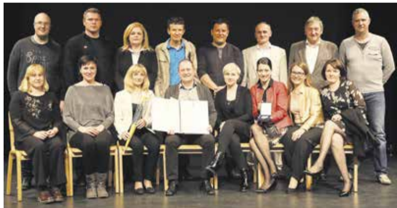
Kulturno društvo Jože Gostič Homec, srebrna plaketa