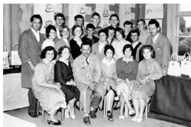
Prva generacija galanterijskih tehnikov z učitelji; naziv so pridobili po štirih letih šolanja. Imeli so kar 24 predmetov: od splošnih do strokovnih, z velikim poudarkom na praktičnem delu.

Glavne direktije za usnje in čevljarstvo industrijo v Ljubljani. V prvi letnik se je vpisalo nekaj deset dijakov iz vseh delov tedanje države Jugoslavije. Prostore so uredili nad staro Pollakovo usnjarno. Hkrati so gradili novo usnjarno, ki je bila dokončana leta 1949. Takrat se je začel praktični pouk. Konec januarja 1955 je šola dobila dijaški dom za 120 dijakov, leto dni pozneje pa je bila ustanovljena tudi vajeniška šola.