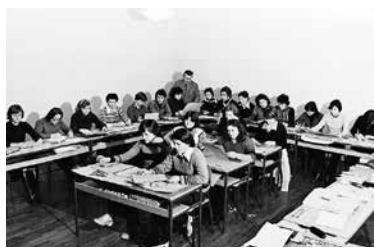
Delo v šolskih delavnicah – krojenje.

V naslednjih desetletjih se je Usnjarski tehnikum večkrat preimenoval in širil svoje dejavnosti. Leta 1956 je nastala Tehniška srednja usnjarska šola Domžale (TSUŠD). Šoli so se priključili še Inštitut za usnjarsko, industrijski obrat, dijaški dom