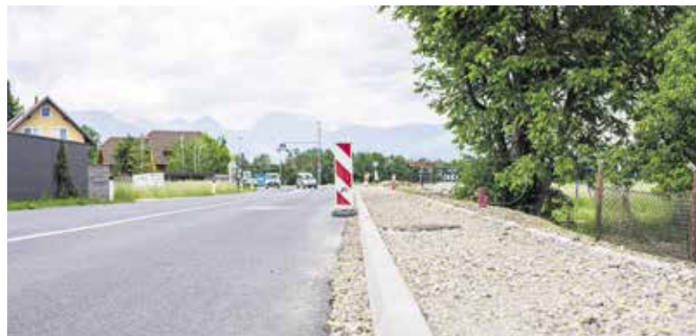
Pločnik v Dragomlju

OBČINA DOMŽALE, URAD ŽUPANA