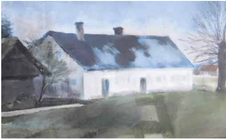
Tablarjeva hiša nekoč; o njej govori stalna slika, ki jo v Prelogu hrani Srečko Kržan.

Srečo Kržan, ki živi v bližini nekdanjega domovanja Rojančevih, pripoveduje, da je Tablar ponoči pomotoma zašel v goščo in padel v jamo. Po treh dneh, ko je bilo v cerkvi na Taboru