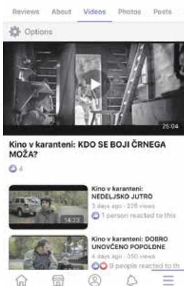
Kino v karanteni

V dveh mesecih smo 'odvrteli' 33 različnih filmov, pri čemer je imel največ ogledov pričakovano Tošl, ki je bil tudi edini domžalski film v programu; takoj za njim stoji Varuh meje, ki se je po vseh letih izkazal za še vedno izredno politično pronicljiv in oster film; in pa še Srečno, Kekec, kar dokazuje, da so filmske klasike še vedno zanimive. Nalašč smo v program uvrstili tudi kar