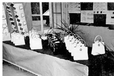
Zaključna razstava prve generacije galanterijskih tehnikov, ok. leta 1964.

V naslednjih desetletjih se je Usnjarski tehnikum večkrat preimenoval in širil svoje dejavnosti. Leta 1956 je nastala Tehniška srednja usnjarska šola Domžale (TSUŠD). Šoli so se priključili še Inštitut za usnjarsko, industrijski obrat, dijaški dom