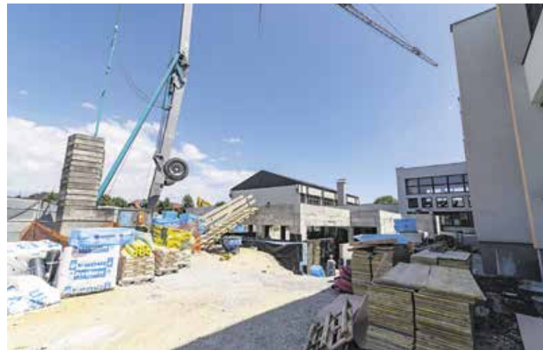
Gradnja jedilnice in preureditev kuhinje na OŠ Domžale