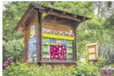
Apiterapevtski učni čebelnjak pri CČN Domžale - Kamnik (Čebelarstvo društvo Domžale)