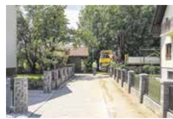
Začetek del na vodovodu in obnova ceste na Homcu

OBČINA DOMŽALE, URAD ŽUPANA