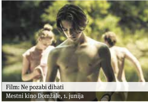
Film: Ne pozabi dihati Mestni kino Domžale, 1. junija