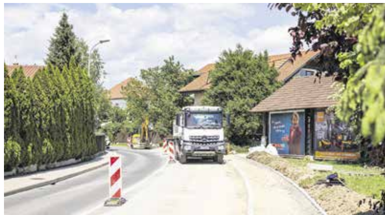
Pločnik na Škrjančevem