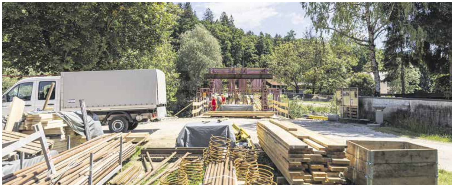
Most pod Šumberkom dobiva novo podobo.