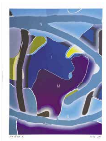
NIMB, 46 x 33cm, 2019

Pogovor Jurija Smoleta z avtorjem si lahko ogledate od torke, 19. maja, od 16. ure dalje na spletni strani Kulturnega doma Franca Bernika Domžale in v prostorih Galerije Domžale.