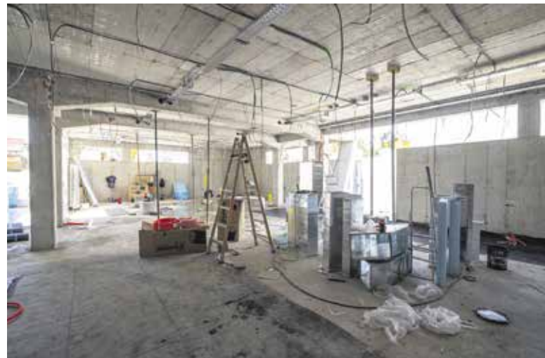
Dela v notranjosti OŠ Domžale