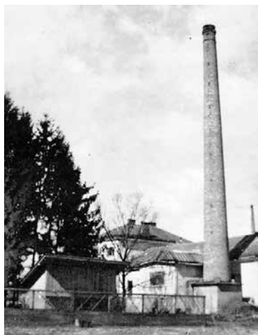
Prve prostore Usnjarskega tehnikuma so uredili v nekdanji Pollakovni usnjarni.

Usnjarski tehnikum je bil ustanovljen leta 1948 s strani Generalne direktije za kožo i gumu v Beogradu in