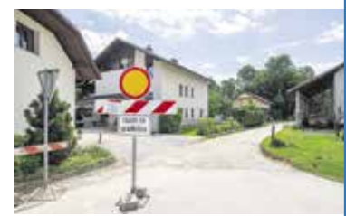
Rekonstrukcija ceste na Krtini