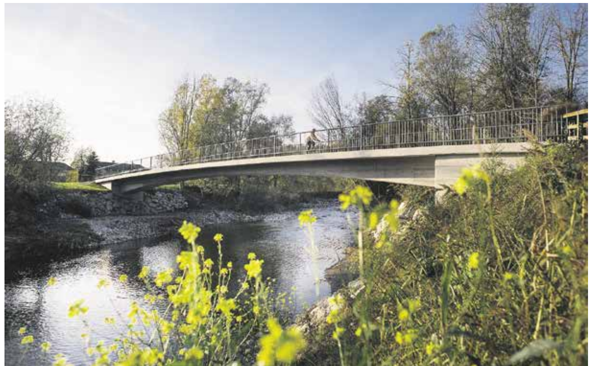
Ste za kolesarjenje?

OBČINA DOMŽALE, SLUŽBA ZA TURIZEM