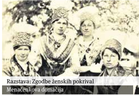
Razstava: Zgodbe ženskih pokrival Menačenkova domačija