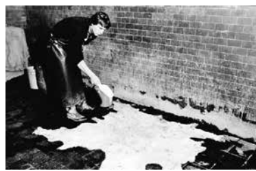
Delo v šolskih delavnicah – usnjarski tehnik.

ter strokovna komisija za pomočniške in mojstrske izpite usnjarske stroke. V tovarni usnja je bilo zaposlenih po 30 kvalificiranih in polkvalificiranih usnarjev. Poslovanje je bilo urejeno tako, da je tovarno vodil strokovni kader, z dohodki pa so vzdrževali tudi