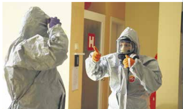
Zdravstveno osebje v času koronavirusa

OBČINA DOMŽALE, URAD ŽUPANA FOTO: WAKEUP CREATION