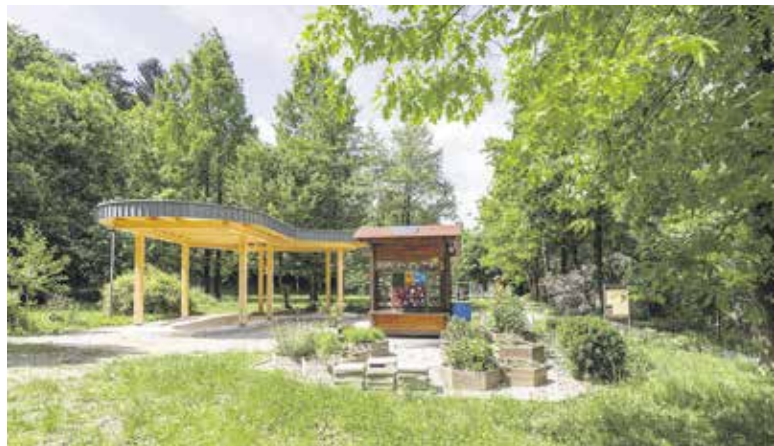
Učilnica na prostem

OBČINA DOMŽALE, URAD ŽUPANA