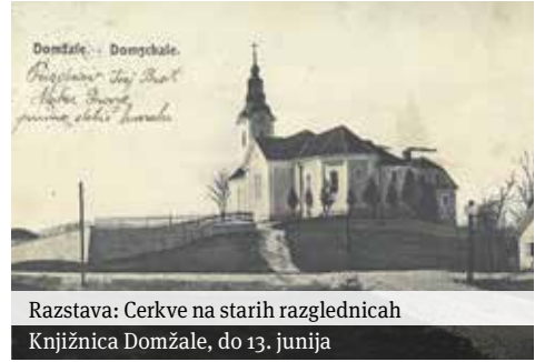
Razstava: Cerkev na starih razglednicah Knjižnica Domžale, do 13. junija