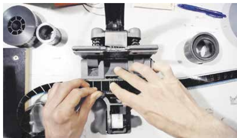
35 mm kinoprojektor

V času zaprtja dvorane pa niso mirovali tudi naši filmski pedagogi, saj so posneli vrsto filmčkov z navodili, kako ustvarjati doma in kako deluje kino – v našem primeru 35-mm projektor, ki ga zadnja leta uporabljamo zelo redko, a je nadvse pomemben del filmske zgodovine. In prepričani smo, da večina ljubiteljev filma ne