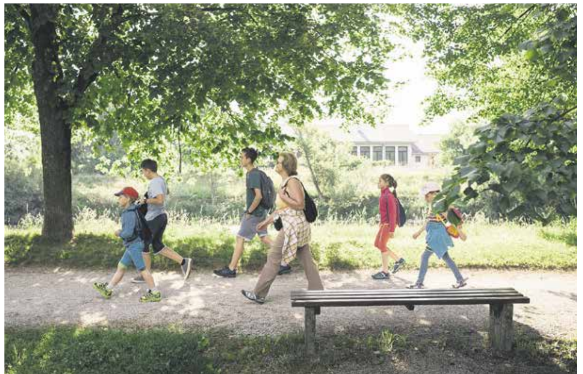
Ali za pohodništvo?