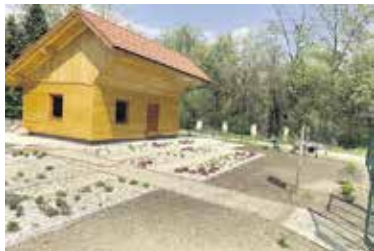
Učni čebelnjak v Dobu