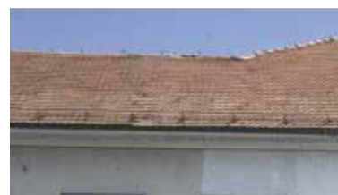
Center za mlade Domžale