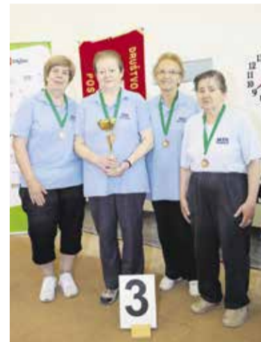
Ženska ekipa MDI Domžale je bila letos na državnem prvenstvu v balinanju tretja.

Problemi, s katerimi se srečujejo invalidi, so jasni in znani. MDI Domžale se s prostovoljci in z izvajanjem programov trudi olajšati vsakodnevne tegobe invalidov, kar jim kljub majhnemu društvenemu proračunu in z drobtinicami iz naslova javnih sredstev, kar dobro uspeva. V zadovoljstvo invalidov, kar je najbolj pomembno. □