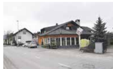
Cvetličarna Slovnik Ihan