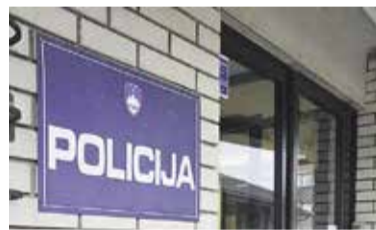
Policijska postaja Domžale