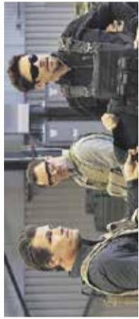
Sicario 2: vojna brez pravil