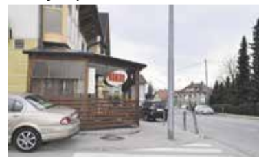
Cafe Rondo Radomlje