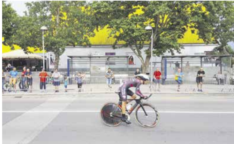
Vožnja na čas Maraton Franja je v Domžalah potekala že četrto leto.

Na okrepčevalnico v Domžale so prispeli že vsi sproščeni in dobre vo-