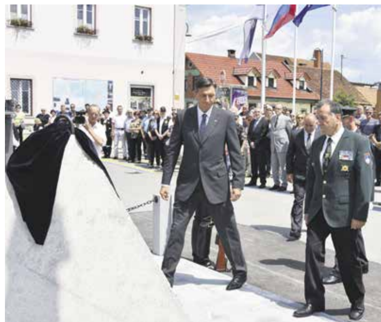
Slovesni trenutek - odkritje pomnika