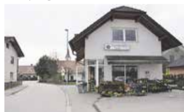
Cvetličarna Vijolica Dob