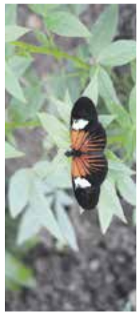
Razstava tropskih metuljev

Koledar kulturnih prireditvev izhaja v glasilu Slamnik. Za točnost informacij odgovarja prijavitelj dogodka. Uredništvo ne odgovarja za spremembe programov in si pridržuje pravico do kraščenja prispelih informacij. Informacije o dogodkih v avgustu 2018 pošljite do 18. julija na naslov: koledar@kd-domzale.si .