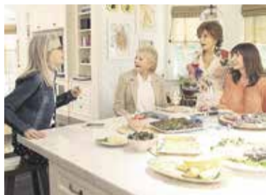
Klub zadovoljnih žensk

svojimi odraslimi otroki, mora ugotoviti, da je nemara že čas za kakšno novo razmerje, ostarelo divo (Fonda), ki se je čustveno zaprla že pred leti in se še vedno zadovoljuje s seksualnimi afericami za eno noč, preseneti vrnitev ljubezni njenega življenja, spoštovana zvezna sodnica (Bergen) pa na sledeč način dobi priložnost, da se spomni še kakšne druge funkcije