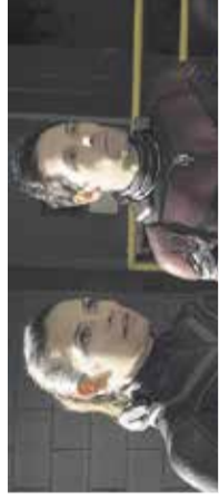
Ant-man in osa

Zgodba o mladostnih sanjah, prijateljstvu, ljubezni in življenjski preizkušnji, ki nenekrat spremeni vse / gledališka igra z glasbo Slavka in Vilka Avsenika – njun bogat glasbeni opus navdihuje mnoge glasbenike in razveseljuje poslušalce vseh generacij.