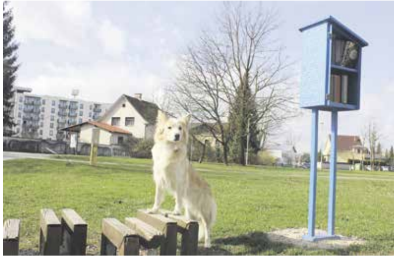
Tanita Fabjan Demšar, Kuža in knjigobežnica

OBČINA DOMŽALE prostor zgodovinskih ljudi