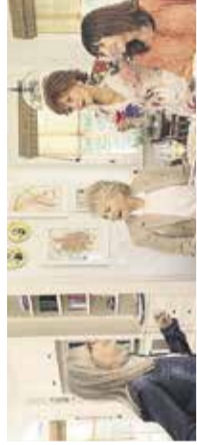
Klub zadovoljnih žensk

Celotni spored za julij in avgust boste našli na www.kd-domzale.si/kino