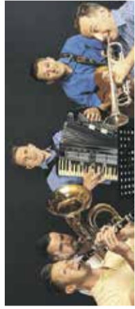
Lepo je biti muzikant