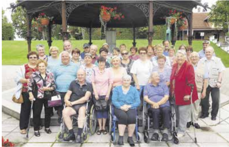
Letšnjega programa za ohranjanje zdravja v Radencih se je udeležilo 40 invalidov.

E na izmed stvari, s katero se moramo kot družba soočiti, je tudi problematika invalidov. Kot polnopravni državljani imajo invalidi enake pravice in so upravičeni do dostojanstva, enakega obravnavanja, samostojnega življenja in popolnega sodelovanja v družbi. Omenjena pravica je zapisana v ustavi.