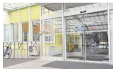
Zdravstveni dom Domžale