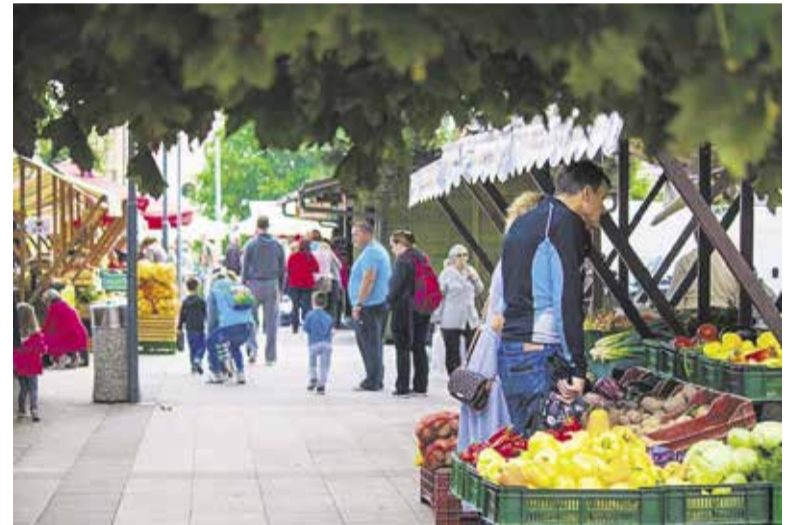
Tržni prostor Domžale

OBČINA DOMŽALE, URAD ŽUPANA FOTO: JURE GUBANC