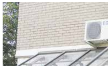
Društvo Verjamem vate – Naša trgovin'ca