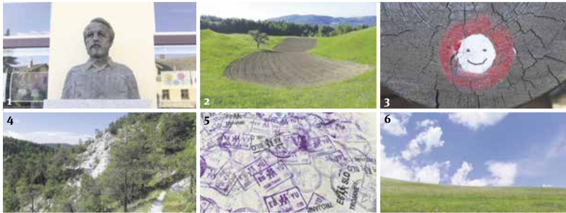
1. Dane Zajc: z ostrino skoncentrirane misli nas pospremi na pot. 2. Delana vrtača z ostrimi prehodi sporoča: delo je življenje. 3. Nasmeh, ki obeta doživeto nadaljevanje hoje. 4. Strmega, spektakularnega melišča tod ne pričakujemo. 5. Križišča, stičišča, mimobežnice: sledi sodobnega človeka. 6. Hoja odstira poglede, pokrajina jih ostri in oživlja.

Ena od lepih skrivnosti tokratne hoje je počasno približevanje pokrajini. Iz Moravč ves čas opazujem cerkev sv. Valentina, ki korak za korakom postaja vedno večja in bolj domača. Ko zapustim hiše v dolini in zasopem v tihi gozd, se začne poglobljati tudi prijateljstvo z goro. Njen značaj nosim