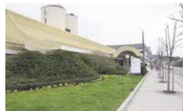
Dom upokojencev Domžale