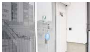
Center za socialno delo Domžale

V Domžalah je varnih točk 17, najdete pa jih po vsej občini.