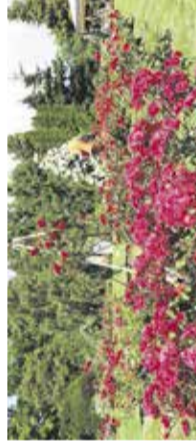
Nega vrtnic poleti