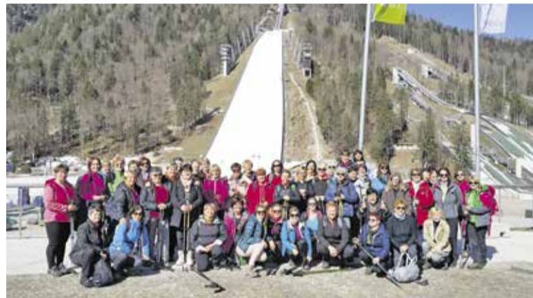
Krtke v Planici po prihodu iz Tamarja

Naslednje jutro smo se po ogrevalnih vajah odpravile do Belopeških je-