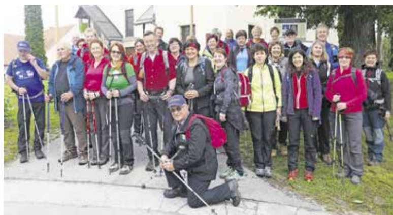
Pohodniki med Slovenskimi gorami

ALEŠ KERMAUNER PLANINSKO DRUŠTVO DOMŽALE