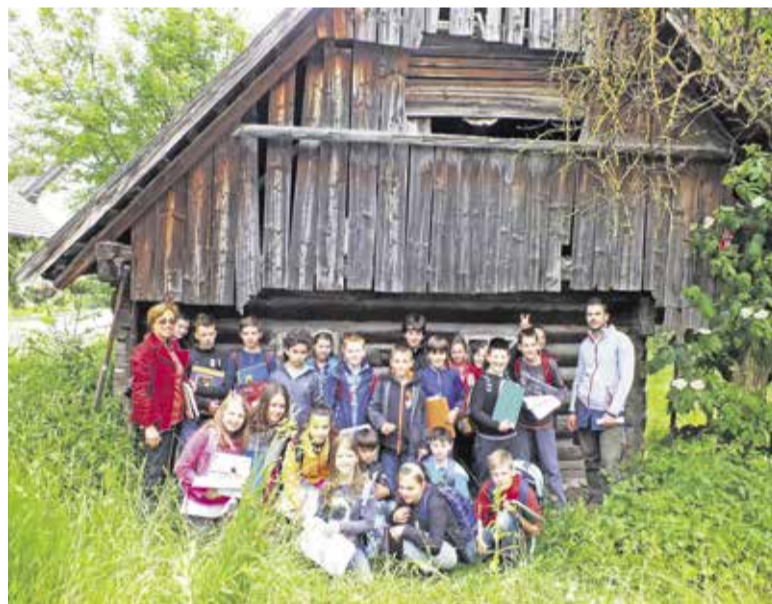
Učenci in učitelji OŠ Rodica pred Kofutnikovo domačijo

Hiša nam pripoveduje o kulturnih sestavinah preteklosti. Tako lahko npr. sledimo celotni kulturi kuhanja pri nas – od odprtega ognjišča in kuhanja v peči, do zidanega štedilnika,