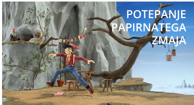
Kratki animirani filmi / različni avtorji / program: Koyaa – izmuzljiv papir, G. Noč ima prost dan, Zmaj, Tok tok, Mitch-match, Oblačno, Princ Ki-Ki-Do: Begunec / 2021, Slovenija, Litva, Češka, Hrvaška, Madžarska / distribucija: Društvo 2 koluta / 34' / brez dialogov, 4+

Otroške abonmaje vpisujemo v mesecu septembru v sodelovanju z vrtci in šolami, namenjen pa je zadnjemu letu vrtca in prvi triadi osnovne šole. V abonmaju je pet predstav, ki si jih otroci ogledajo med šolskim letom v KD Franca Bernika, lahko pa vpišete tudi skrajšani abonma s tremi predstavami (Popotovanje papirnatega zmaja, Povodni mož Ambrož, Ponočnjaki). Otroci predstave obiskujejo v dopoldanskem času v sklopu svoje vrtčevske skupine ali šolskega razreda. Vpisni listi bodo septembra na voljo pri vzgojiteljicah v vrtcih in razredničarkah v šolah.